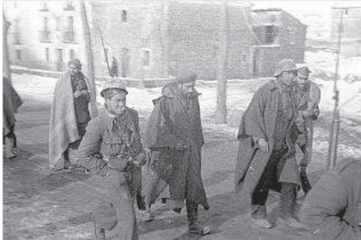
Tropas republicanas en Aragón, 1938.

se quedó patas arriba. La segunda pieza también disparó correctamente, pero con un retroceso tal que se desplazó cinco metros atrás arando la tierra. Además, al disparar el cañón se encabritó y se transformó en un mortero, y el proyectil se fue muy lejos, pero hacia el cielo, hasta que cayó en nuestra primera línea. Por suerte, lo hizo en un sitio desierto. Después de este espectáculo, Morales me dijo: