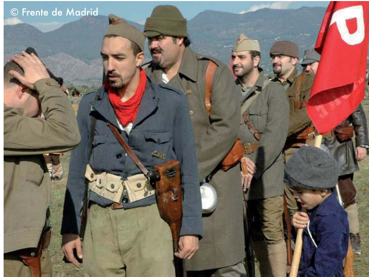
Formación de tropas en hilera.

Hombre de base o guía general.-La clase o soldado por el cual se alinea o regula la marcha de una tropa.