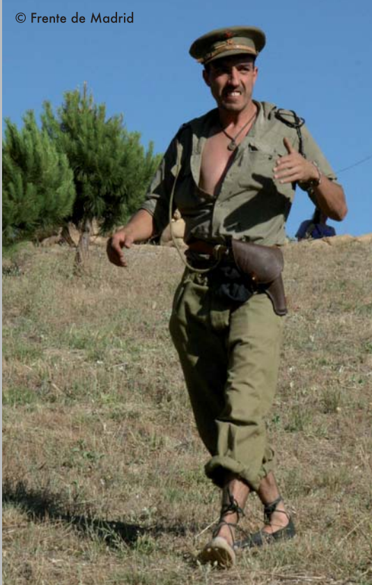
Para combatir los rigores del verano, este oficial lleva la camisa desabrochada, los pantalones remangados y las clásicas alpargatas.