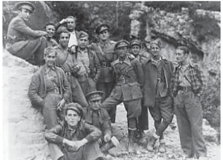
Integrantes de la 43ª División en la localidad de Bielsa.

- Míralo, pero no lo toques. Quema como el infierno, y no me queda ni una sola bala. Los cabrones de guardias de asalto, a medida que les enseñaba las posiciones y sabían dónde estaba el enemigo, se pasaban corriendo con las armas incluidas. Les he disparado un montón de veces. pero no se si he dado a alguno.