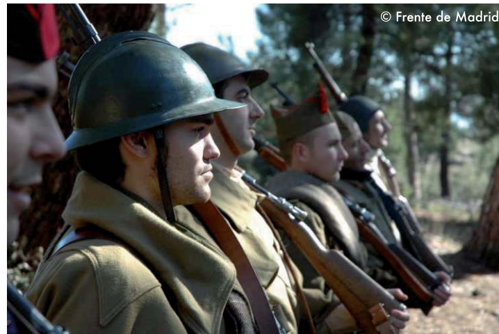
Formación de tropas en fila.

formación en la que las fracciones o elementos están colocados unos al costado de otros con el mismo frente, cualquiera que sean sus distancias e intervalos.