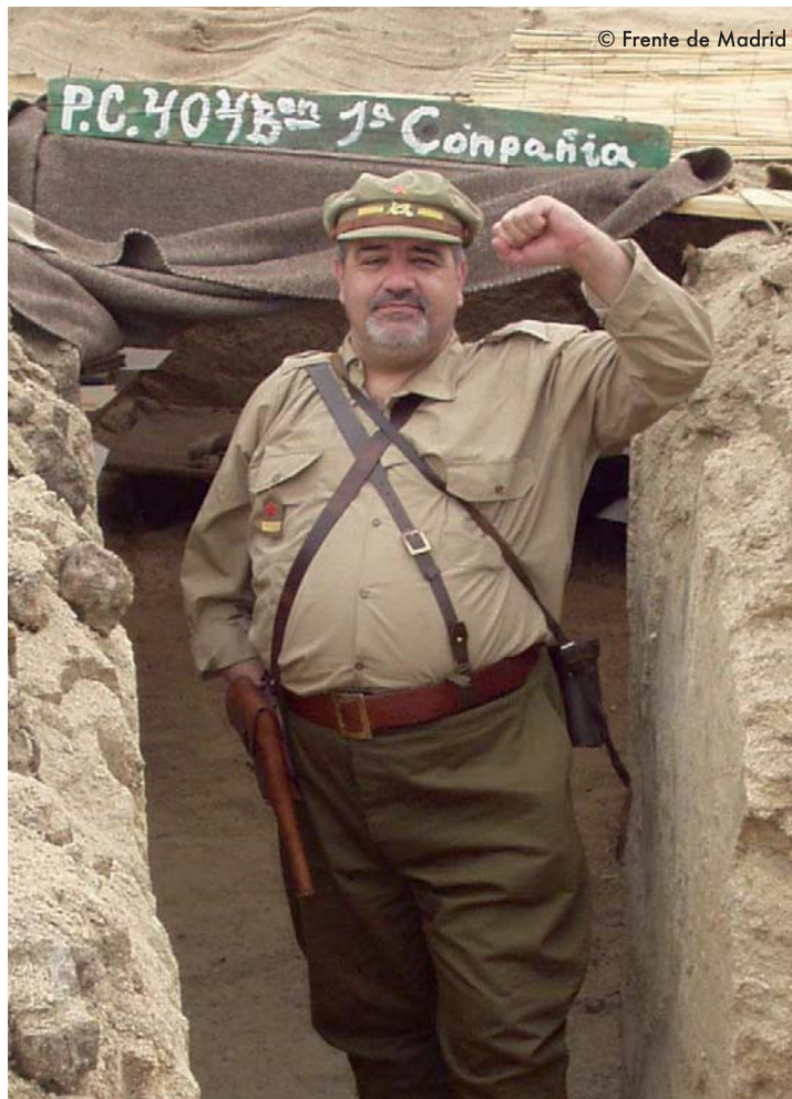
Comandante republicano con gorra de plato de imperial blando. A ambos lados del emblema de infantería luce 4 barras doradas, 2 a cada lado, y coronadas por una estrella roja de 5 puntas.

En tiempo caluroso los oficiales suelen ir en mangas de camisas. Se utilizan muchos tipos de camisas diferentes, desde las