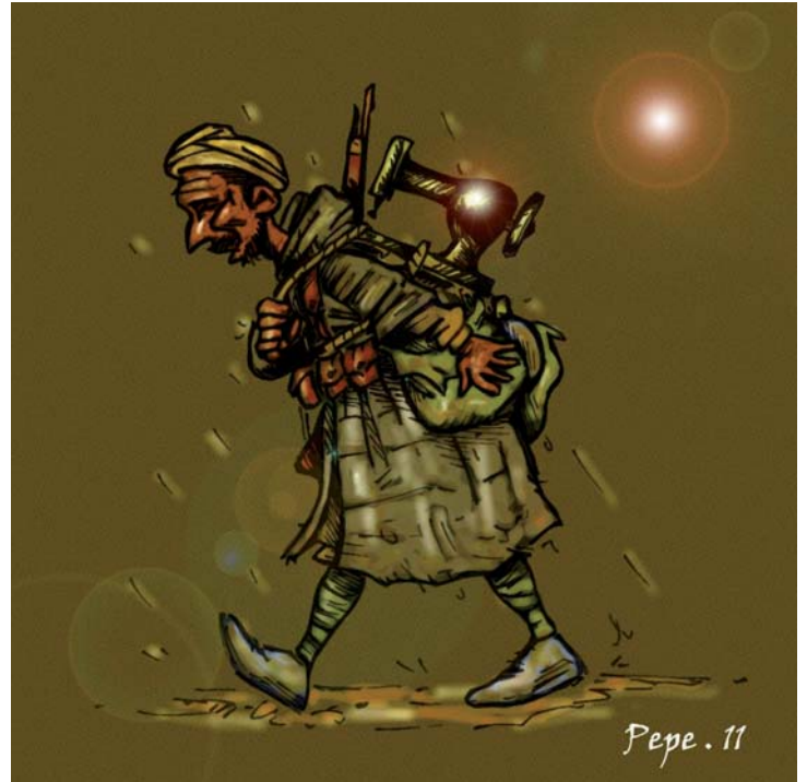
Entre Carmen cantando ópera rodeada de bandoleros y aquel moro acarreando una máquina de coser en la marcha de los sublevados hacia la capital republicana no había tanta diferencia.