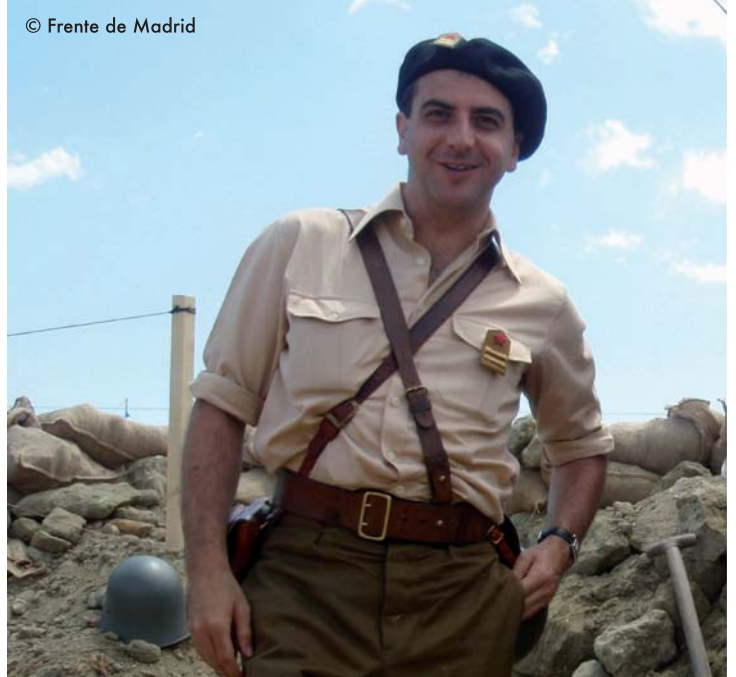
Teniente del Ejército Popular tocado con una boina, otra de las prendas de cabeza muy utilizadas por los oficiales republicanos. Viste camisa de color arena con las mangas remangadas.