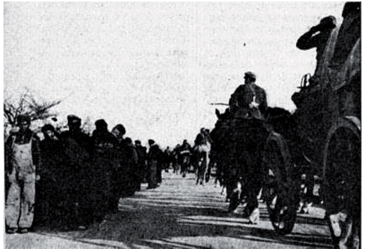
Prisioneros republicanos de la 16 División capturados cerca Fraga, Huesca, marzo 1938.