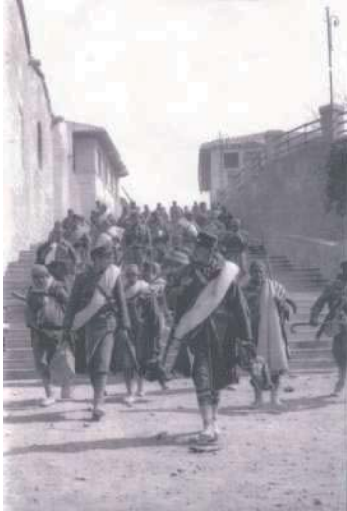
Tropas Regulares en Caspe, 1938.