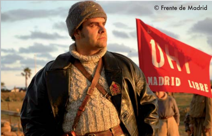
Durante la Batalla de Madrid era muy común la utilización simultánea de las antiguas divisas junto con las de reciente implantación. Este capitán luce 3 estrellas de 6 puntas en el pasamontañas y 3 barras rojas (capitán de milicias) en la solapa de su chaquetón de cuero.

jefes. Siguiendo una reglamentación similar en cuanto a rango; 3 barras-capitán, dos barras-teniente, etc... Las barras están coronadas por una estrella roja de 5 puntas de 25mm de diámetro. En un principio se diferencia la escala de milicias con barras de color rojo, aunque pronto deja de mantenerse esta diferencia.